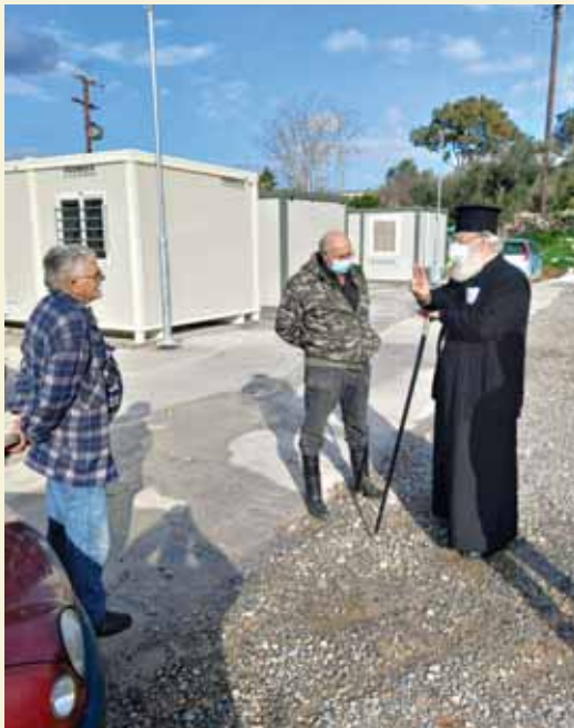
Ό Σεβ. Μητροπολίτης κ. Άνδρέας σέ μία από τίς πολλές έπισκέψεις του στόύς έμπερίστατους από τό σεισμό άδελφούς, οί όποίοι διαμένουν σέ οίκίσκους. (Άπρίλιος 2022)