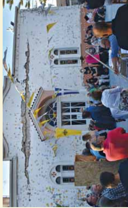
Ἀπό τόν πανηγυρικό Ἐσπερινό στόν αὐλαιο χῶρο τοῦ βاریα λαβωμένου ἀπό τό σεισμό Ἱεροῦ Καθεδρικοῦ Ναοῦ Μεταμορφώσεως τοῦ Σωτήρος Ἀркаλοχωρίου. (Αὐγουστος 2022)