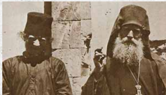
Ὁ Ἅγιος Ἀνθίμος τῆς Χίου (δεξιά) μέ τόν Ἅγιο Νικηφόρο τόν Λεπρό (ἀριστερά).

Σωφρόνιος χειροτονήθηκε διάκονος καί τήν ἐπομένη ἡμέρα πρεσβύτερος, στήν Ἱερά Μονή τῆς Παναγίας Καλυβιανῆς, ἀπό τόν Ἀρχιεπίσκοπο Κρήτης Τιμόθεο καί ἔλαβε τό ὄνομα Εὐμένιος.