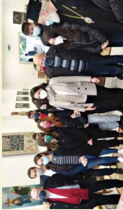
Ἀπό τὴν ἐπίσκεψη τῆς Ὑπουργοῦ Παιδείας καὶ Θρησκευμάτων κας Νίκης Κεραμέως στὸ Πολιτιστικό Πολύκεντρο τῆς Ἱεράς Μητροπόλεως, μὲ μαθητὲς τοῦ Ἀρκαλοχωρίου. (Φεβρουάριος 2022)