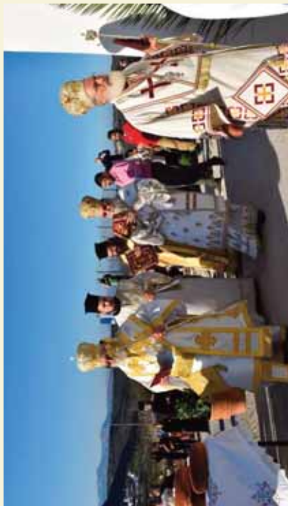
Άπό τόν Έγκαινισμό τοῦ Ἱεροῦ Ναοῦ Προφήτου Ἡλιοῦ, στόν ὁμίονο Λοφο στό Ἀρκαλοχώρι, μέ τή συμμετοχή τῶν Σεβ. Μητροπολιτῶν Κισσίου καί Σελίου κ. Ἀμφιλοχίου καί Κυδωνίας καί Ἀποκρόνου κ. Δαμασκηνοῦ. (Σεπτέμβριος 2022)