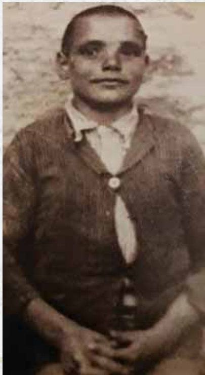
Ὁ Ἅγιος Εὐμένιος, ὡς μικρὸς Κωνσταντῖνος

σία τοῦ χωριοῦ του καὶ στὰ γύρω ἐξωκκλήσια, προσευχόμενος καὶ κάνοντας ἀγρυπνίες τὰ βράδια.