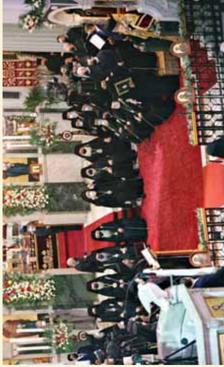
Από την ἐνθρόνιση τοῦ Σεβ. Ἀρχιεπισκόπου Κρήτης κ. Εὐγενίου, στον Ἱερό Μητροπολιτικό Ναό Ἁγίου Μηνᾶ Ἡρακλείου. (Φεβρουάριος 2022)