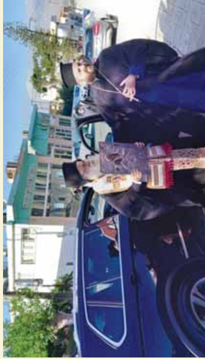
Από την ύποδοχή της 'Ιεράς Εικόνας Παναγίας 'Ελεούσης «Ρεΐζντερε», την όποια κόνισε ο Σεβ. Μητροπολίτης 'Ιεραπότνης και Σητείας κ. Κυρίλλος, κατά τον πανηγυρικό 'Εσπερινό του Άγιου Ανδρέου Αρχιεπισκόπου Κρήτης, στο Άρκαλοχώρι. (Ιούλιος 2022)