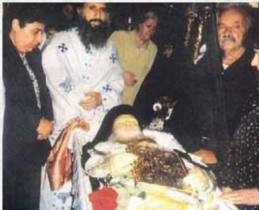
Άπό τήν ἐξόδιο ἀκολουθία τοῦ Ἁγίου.

ταβιώνει, στήν τότε Ἱερά Μονή ὡς δόκιμος καί στή συνέχεια κείρεται μοναχός, ἐν μέσῳ Θείου γνόφου, μέ τό ὄνομα Σωφρόνιος, στόν σπηλαιώδη ναό τῆς Μονῆς τοῦ Ἁγίου Νικήτα. Ἐκεῖ ἐγκαταβιώνει περί τίς δύο δεκαετίες. Ἐν συνεχείᾳ χειροτονεῖται διάκονος καί πρεσβύτερος, τό