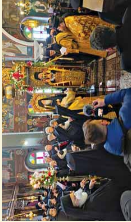
Άπό τήν ἐνθρόνιση τοῦ Σφβ. Μητροπολίτη Ρεθύμνης καί Αὐλοποταίου κ. Προδρόμου στόν Ἱερό Μητροπολιτικό Ναό Εισοδίων τῆς Θεοτόκου Ρεθύμνης. (Μάρτιος 2022)