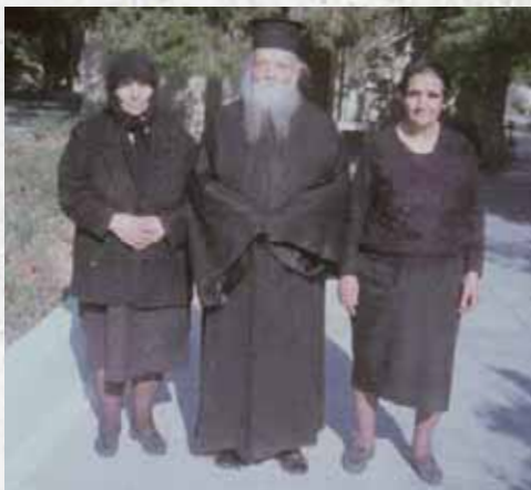
Ὁ Ἅγιος Εὐμένιος μέ τίς ἀδελφές του Εὐγενία καί Ἀμαλία.

γνωστός γιά τήν ἀγιότητα τοῦ βίου του καί προσέτρεχαν πλήθος πιστῶν γιά νά ὠφεληθοῦν ἀπό τόν στοργικό καί ἀπλοῦν χαρισματικό Γέροντα Εὐμένιο. Ὁ Ἅγιος Εὐμένιος διετέλεσε τεράστιο ποιμαντικό, κατηχητικό, φωτιστικό, ἐξομολογητικό καί ἱεραποστολικό ἔργο.