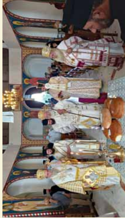
Από την πανήγυρη του 'Ιερού Μητροπολιτικού Ναού Αγίου Ανδρέου Αρχιεπισκόπου Κρήτης, στο Άρκαλοχώρι, συλλειτουργούντων τῶν Σεβ. Μητροπολιτῶν Κισάμου καί Σελίνου κ. Ἀμφιλοχίου, 'Ιεραπότνης καί Σητείας κ. Κυρίλλου καί Ἀρκαλοχωρίου, Καστέλλιου καί Βιάνου κ. Ανδρέου (Ιούλιος 2022)