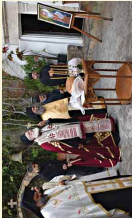
Άπό τόν Έσπερινό πού τελέστηκε στό Ίερό Προσκύνημα τού Άγίου Νικήτα στόν Άχεντριά Άστερουσίω, μετά τήν Άγιοκατάβαση τού Άγίου Εϋμενίου, Ί. Μονή τότε, όπου έκάρη μοναχός τό 1951. (Μάτιος 2022)