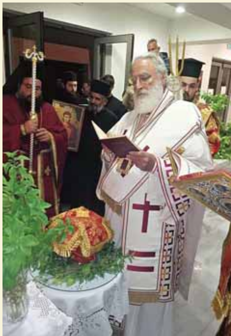
Άπό τά ἐγκαίγια τοῦ παρεκκλησίου τοῦ Πολιτιστικοῦ Πολυκέντρου, ἐπ' ὄνοματι τοῦ Ἁγίου Νέστορος. (Ὀκτώβριος 2022)